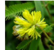
オカミズオジギソウ花