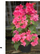
完成形 レインボー